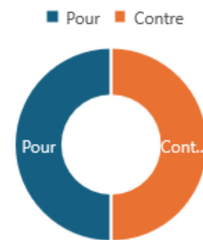
Figure 1 : Option sur la vaccination contre la grippe des enfants

L'étude révèle que, bien que 50 % des parents professionnels de santé soient favorables à la vaccination antigrippale, aucun enfant de l'échantillon n'a été vacciné. Les principaux freins sont la peur des effets secondaires (59 %) et le manque de recommandations claires (33,3 %). Ces résultats, cohérents avec les études internationales, soulignent l'hésitation des professionnels de santé liée à un manque d'information et à des doutes personnels. Par ailleurs, les options adaptées aux enfants, comme les vaccins nasaux, restent peu utilisées par manque de sensibilisation et d'accès. Une meilleure communication et des campagnes ciblées sont nécessaires pour améliorer l'adhésion.